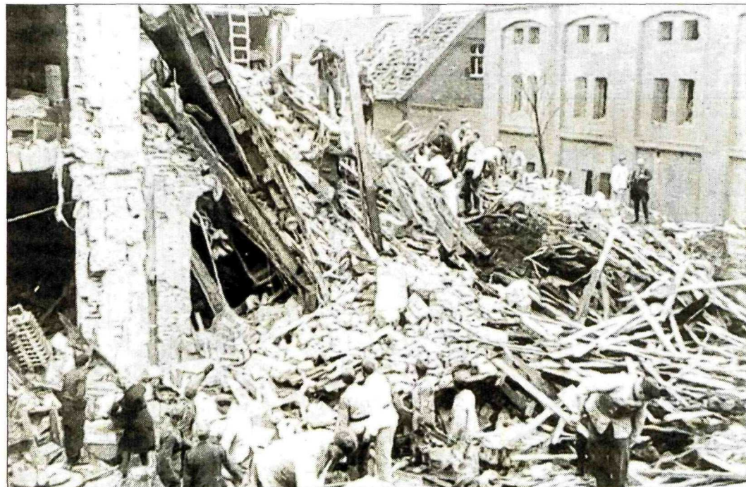
Aufräumarbeiten in der Kampfstraße: Der erste größere Luftangriff erfolgte am 29. Dezember 1943.