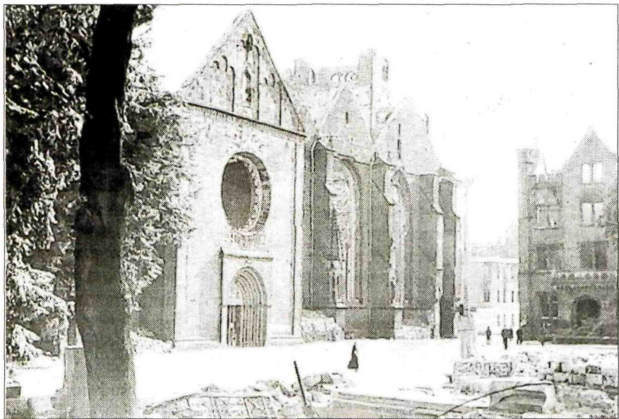
Ein Stadtbild vergeht: Der Dom und das angrenzende Stadthaus wurden schwer getroffen (links). Die zerstörte Häuserzeile zwischen Hohnstraße und Scharnstraße, in der die Trümmer rauchten, wurden nach Kriegsende nicht wieder aufgebaut (rechts).